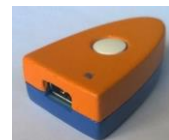
Ancienne version Fonctionnement identique

Le bouton poussoir permet de changer de mode de fonctionnement par un simple ON/OFF.